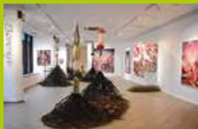
Wernisaż wystawy Ukorzenie