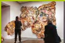
Wernisaż wystawy Przedpokój. Herstories