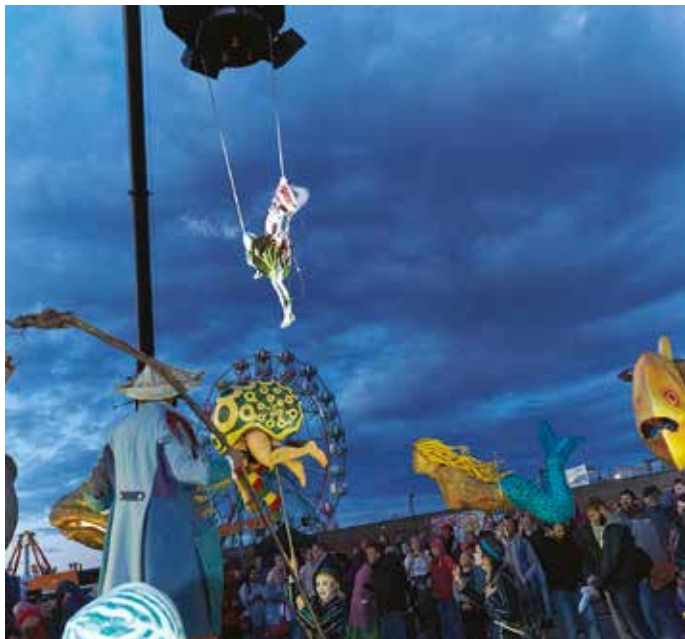
Mù – Cie Transe Express © Nikola Milatovic La Strada