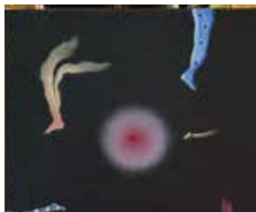
Teresa Sztwernia, Mój ból, 2026, olej na płótnie

Opowiadanie o naszych małych, wielkich sensach (Prolog) – malarstwo, rysunek, kolaż, grafika, plakat, techniki własne.