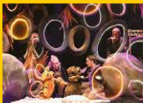
Ach, jak cudowna jest Panama!