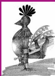
rys. H. Cebula