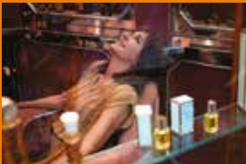
Wolność po włosku