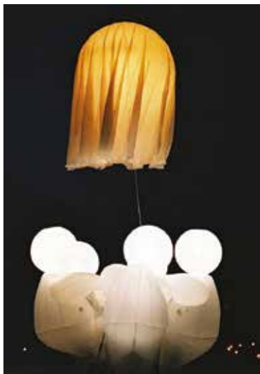
Sen Herberta