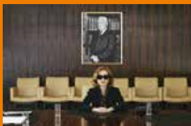
Najbogatsza kobieta świata