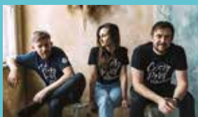
Cztery Pory Mitowania