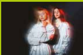
Malta Biennale