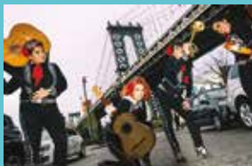
Flor de Toloache