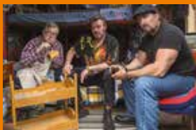
Chłopaki z baraków