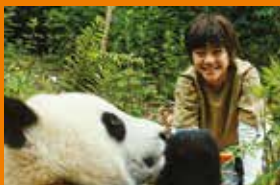
Moon. Panda i ja