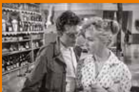
Popiół i diament