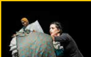
Książniczka na ziarnku grochu