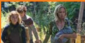
Ciche miejsce 2