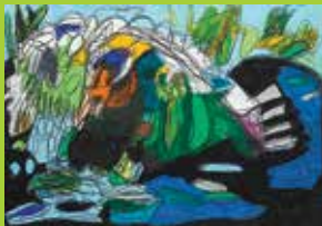
Igor Bryzek, Spotkanie z naturą, 2019, pastel, papier