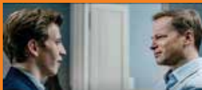
Sala samobójców. Hejter