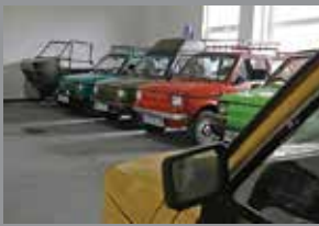
Ekspozyty w Muzeum Fiata I26p