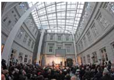
Dziedziniec zamku Sułkowskich