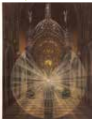
Krystyna Hierowska Redemptoristi-Crown 500, mezzotinto

17 pełna kultura! / galerie, nr 2/206, II 2020