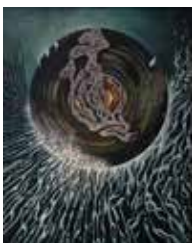
Józef Sowada, Przemijanie II, 1987

14 pełna kultura! / galerie, nr 2/206, 11 2020