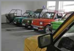
Ekspozyty w Muzeum Fiata 126p