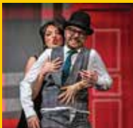
Hotel Westminster