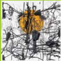
Ireneusz Walczak, Zeitgeist II, 2017