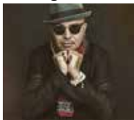
Dhafer Youssef