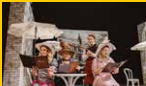
Pensjonat pana Bielańskiego