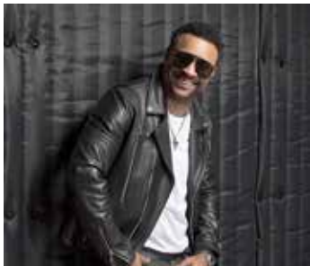
SHAGGY

16 czerwca, godz. 18.00, teren obok hali pod Dębowcem Hyży, Natalia Szroeder