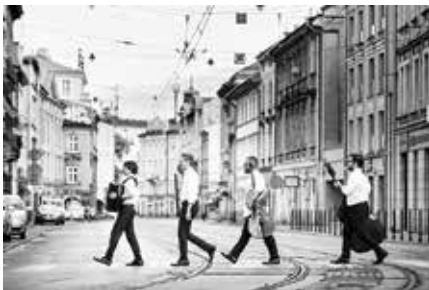
Etnos Ensemble, fot. Piotr Markowski

1 czerwca, godz. 20.30, Metrum Jazz Club