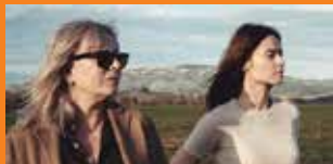
Słodki koniec dnia