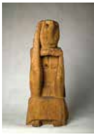
Antoni Rząsa, Zadumana, 1960, drewno, 67,5 x 29 x 21,5 cm