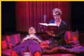
Seks dla opornych