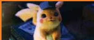
Pokemon. Detektyw Pikachu